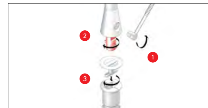
Der Poller kann so auch temporär entfernt werden.