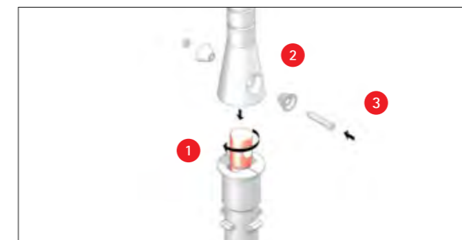
Das Verbindungsstück wird ausgetauscht.