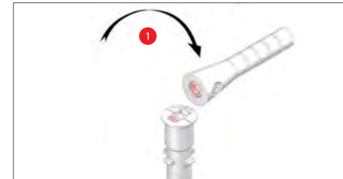
Das austauschbare Verbindungsstück bricht an der Sollbruchstelle.