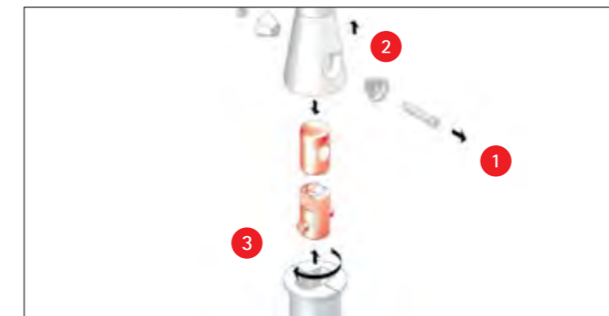
Das gebrochene Verbindungsstück wird gelöst und entfernt.