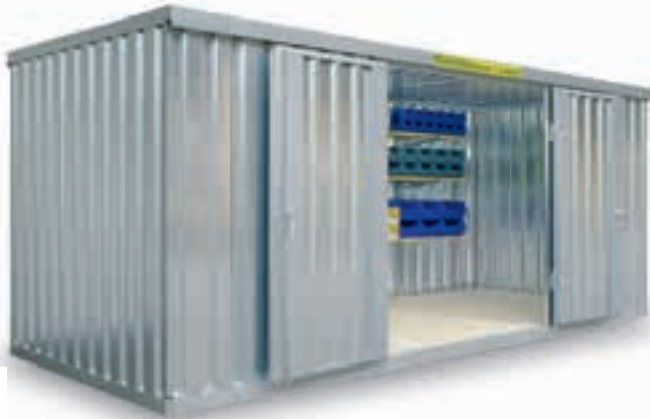
STMC 1500 (31930) mit Doppelflügeltür 1.800 mm (auf Anfrage) und Regaleinrichtung (nicht enthalten)