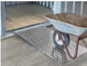
Optional erhältlich: Auffahrrampe für stufenloses Beladen